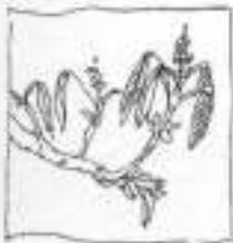
Fra Viggo Bentzons skitsebog.

Det er stadig at se at ligner kædet sammen med blomster