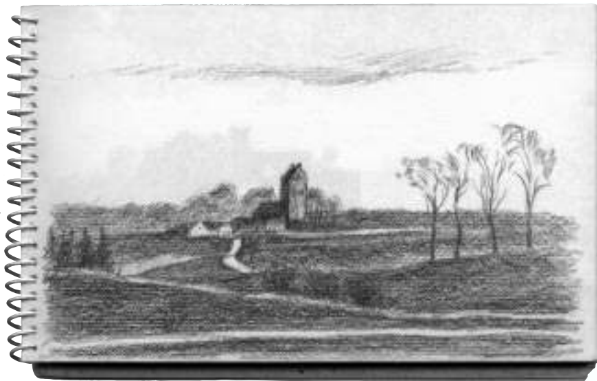
Udsigt fra Mønge mod Valby kirke. Fra Viggo Bentzons skitsebog.

begyndende efterår. Huset havde ikke el dengang - så det kunne være noget af en oplevelse at gå op ad den lange trappe med regn og vind susende om ørerne.