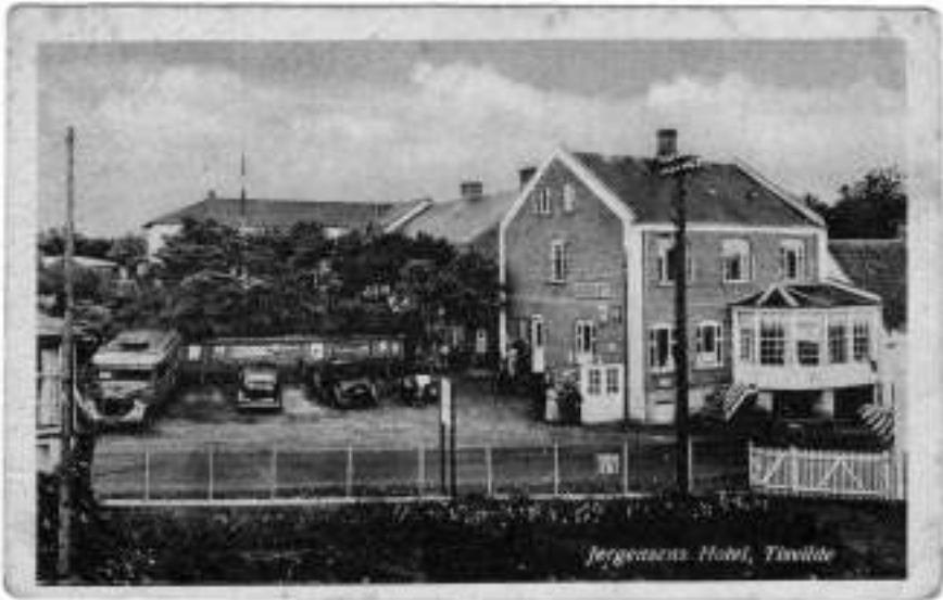
Jørgensens Hotel i Tsvildeleje i 1930'erne inden hotellet skiftede navn til Hotel Tsvildeleje.