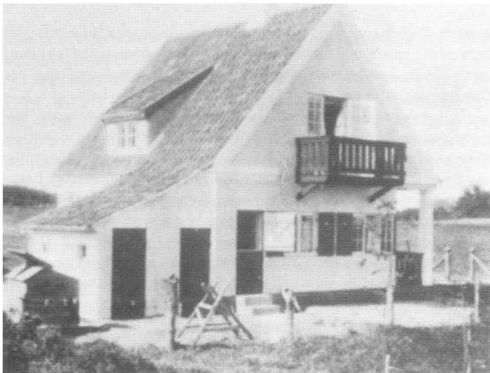
Køkkensiden og brønden.

Husførelsen gik i faste rammer. De handlende - mælkemand, bager og slagter - kørte rundt med deres varer i hestevogne. Jeg husker den lille hvide slagtervogn, hvis bagende kunne åbnes, så en klap dannede bord og en klap halvtag, og slagteren, der stod med sit engang hvide forklæde og skar kød ud. Mælkemanden kom dagligt, og som små drenge fik vi lov at klatre op og sidde på bukken op til landevæjen, mens mælkedrengen hang grinende bag på vognen eller satte sig oven på taget. Ud gennem vognens låger ragede blanke messinghaner, hvorfra man tappede sødmælk og kæmemælk i de kander, vi kom med. Mælkemanden hentede mælken om morgenen kl. 5.30 på Orby mejeri - og som større drenge tog vi af og til tidligt om morgenen op på mejeriet og så det arbejde.