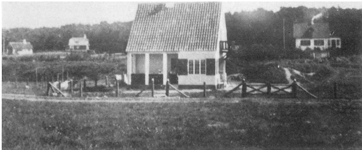
Det nybyggede hus 1918.

På den erhvervede grund byggede far et toetagers muret hus efter egne tegninger. Der benyttedes lokale håndværkere og huset stod færdigt i foråret 1918 og blev første gang taget i besiddelse i sommerferien