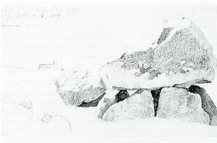
J Th. Lundbye: Kæmpegrav. Hanebjerg ved Vejby - 1838

Fra ældre stenalders mangetusindårige forløb kendes kun ganske få levn. Nævneværdig er kun en økse af hjortetak af sen type, fundet under krigen i Hesselbjerg Mose og overladt Gilleleje museum i 1989. Når fundene svigter skyldes det dels, at tidens tlinterredskaber er uslebne og ret groft tilhugge de og derfor i mindre grad tiltrækker sig opmærksomhed end yngre stenalders typer. Dels skyldes det landskabets karakter. Midt gennem Rågeleje by løber den nu delvist