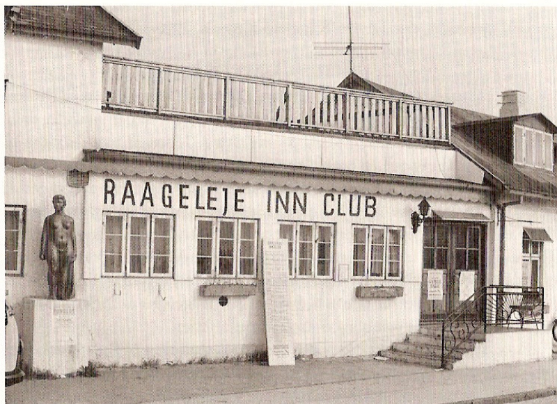
RÅGELEJE KRO som diskotek: Bemærk »spisesedlen« med de mange aktiviteter. Statuen t.v. i billedet blev stjålet i forsommeren 1981: Foto: Kurt Wagner.

måtte åbne. Det var ordrer fra politimesteren, og vi blev behandlet som uvorne knægte. Jeg var 21 og Per lidt yngre.