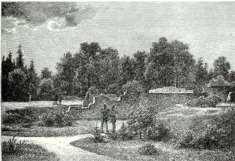
Asserbo ca. 1870

Arkivets ønsker for fremtiden er, at samlingerne må blive så rigelige, at der virkelig kan blive materiale at studere og bruge både for private og institutioner.